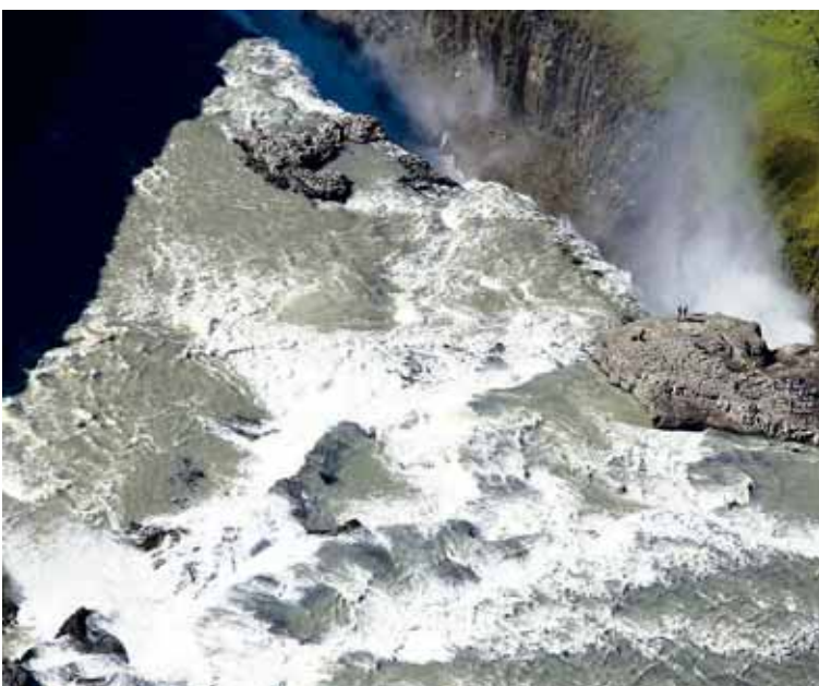
Gullfoss Einn glæsilegasti foss landsins laðar að sér fjölda ferðamanna.