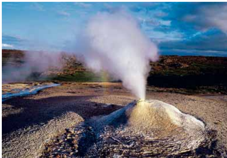
Öskurhöll Á Hveravöllum er óraskað svæði, sem er friðlýst náttúruvætti.