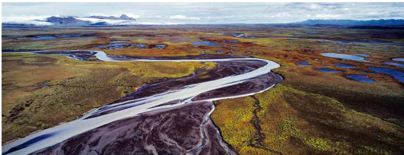
Pjósárver Landsvirkjun er ekki heimilt að fara með lón inn í friðlandið, né heldur að taka um of vatn frá svæðinu svo að grunnvatnsstaða þar lækki mikið.