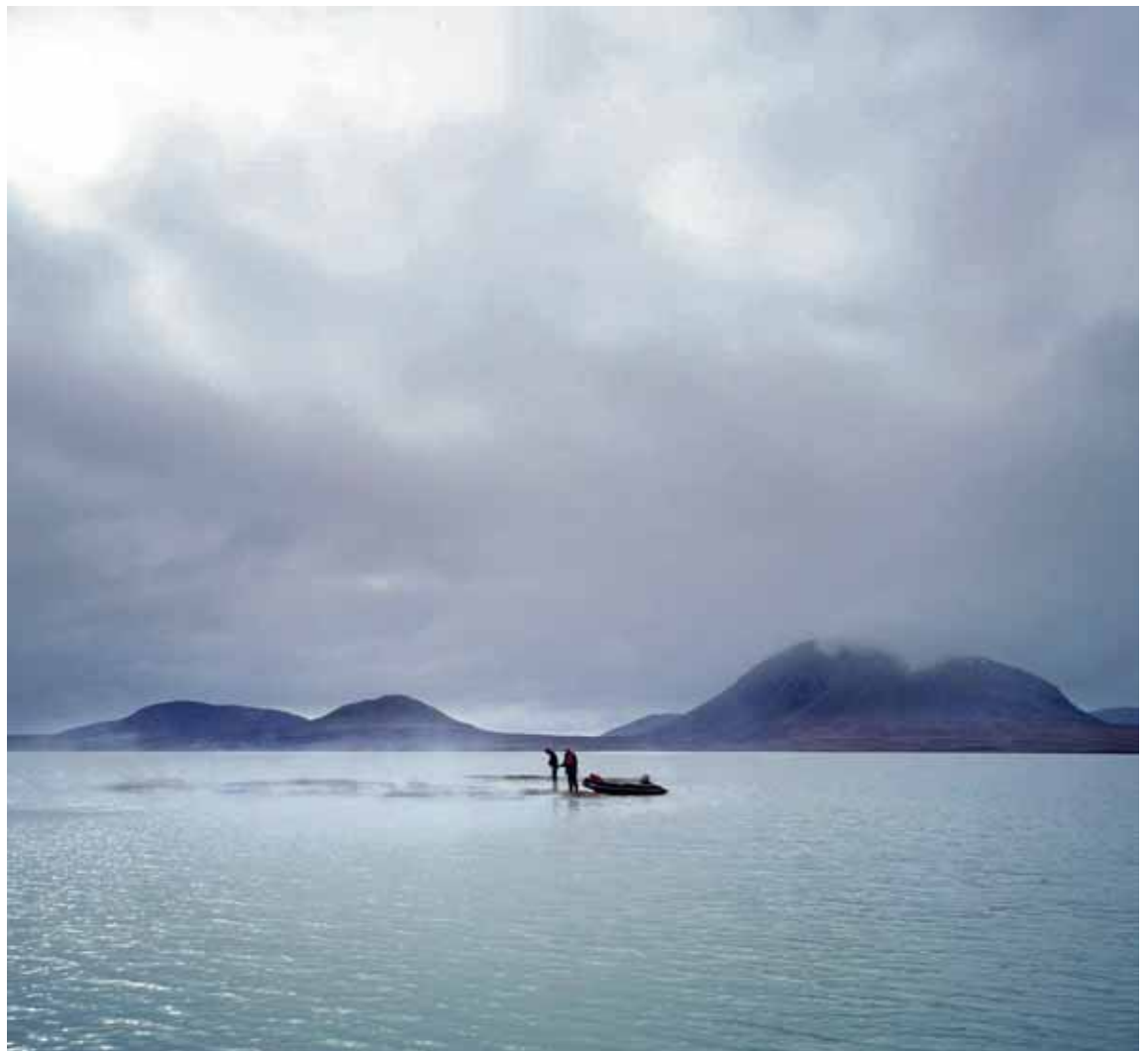
Hágöngur Háhitasvæðið þar fór að miklu leyti undir lón. Landsvirkjun rannsakar hitann með virkjun í huga.