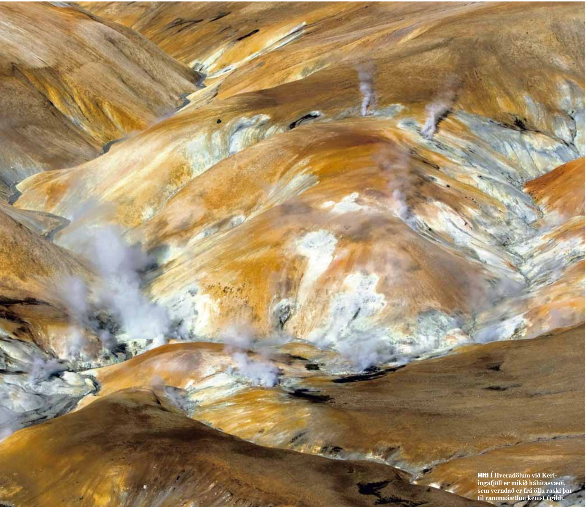
Hiti Í Hveradölum við Kerlingarfjöll er mikið háhitasvæði, sem verndað er frá öllu raski þar til rammaáætlun kemst í gildi.