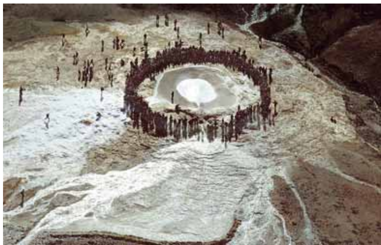
Geysir Háhitinn í Haukadal verður tekinn til samanburðar.