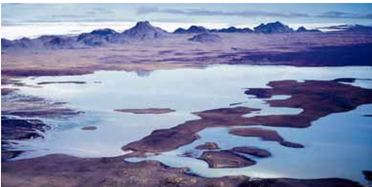
Far Sandvatn var stækkað til að hefta fok, eins og ráðgert er um Hagavatn.