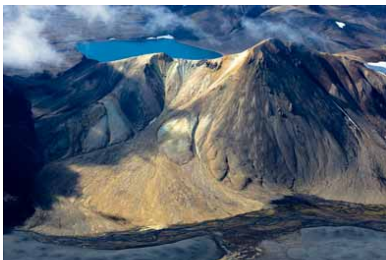
Vonarskarð Kvíavatn er rétt hjá, umkringgt Ógöngum, Skrauta og Kolufelli.